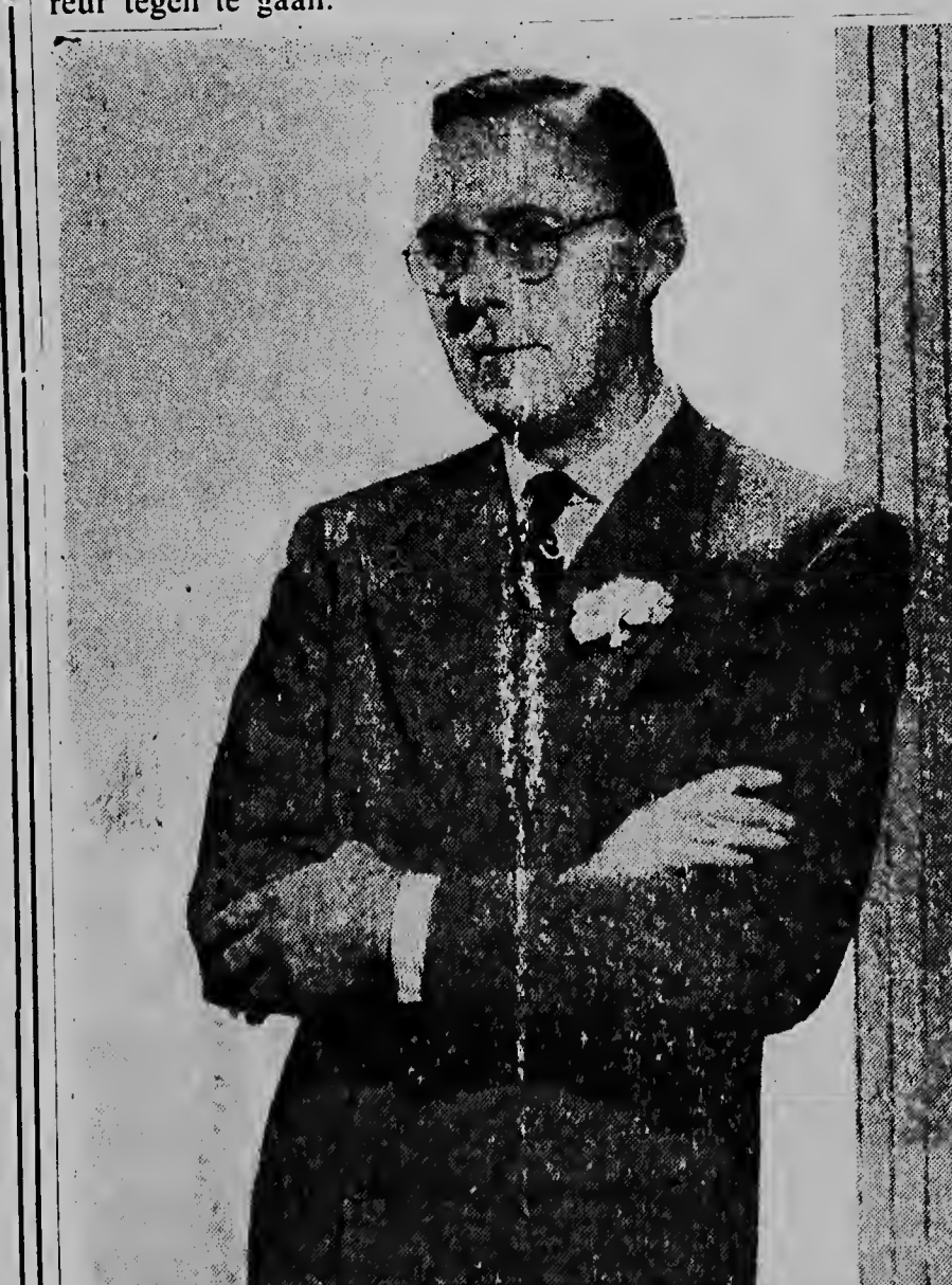
Awe S. A. R. Principe Bernhard a cumpli 45 anja di edad y na e ocasion aki nos ta expresa nos deseo pa hopi anja mas di bida feliz pa e hubilarlo den union di tur esnan cu ta mas caro na su afecto.

NEW YORK. — Volgens de „New York Herald Tribune” houdt men in Washington rekening met de mogelijkheid, dat de Sovjet-leiders de huidige critiek op hun houding tijdens Stalins leven toelaten als voorbereiding van de bekendmaking, dat Stalin indertijd werd vermoord. Deze gevolgtrekking wordt gemaakt naar aanleiding van de publicatie in de „Pravda” van een artikel in het Amerikaanse communistische blad „Daily Worker”, waarin gevraagd werd, wat de huidige Sovjet-leiders indertijd gedaan hebben om Stalins terreur tegen te gaan.